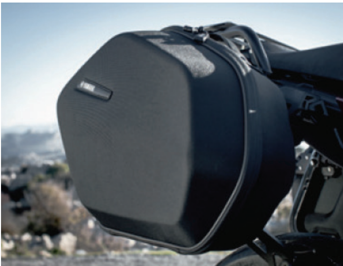
Soft ABS Seitenkoffer-Set Bestell- bzw. Teilenummer 2PP-FS0SC-00-00

Betroffene Halterinnen und Halter oder Benutzerinnen und Benutzer, bei deren Koffern die Umrüstung noch nicht erfolgt ist, kontaktieren bitte umgehend eine Yamaha-Vertragswerkstatt bzw. für weitere Informationen den Hersteller unter info@yamaha-motor.de .